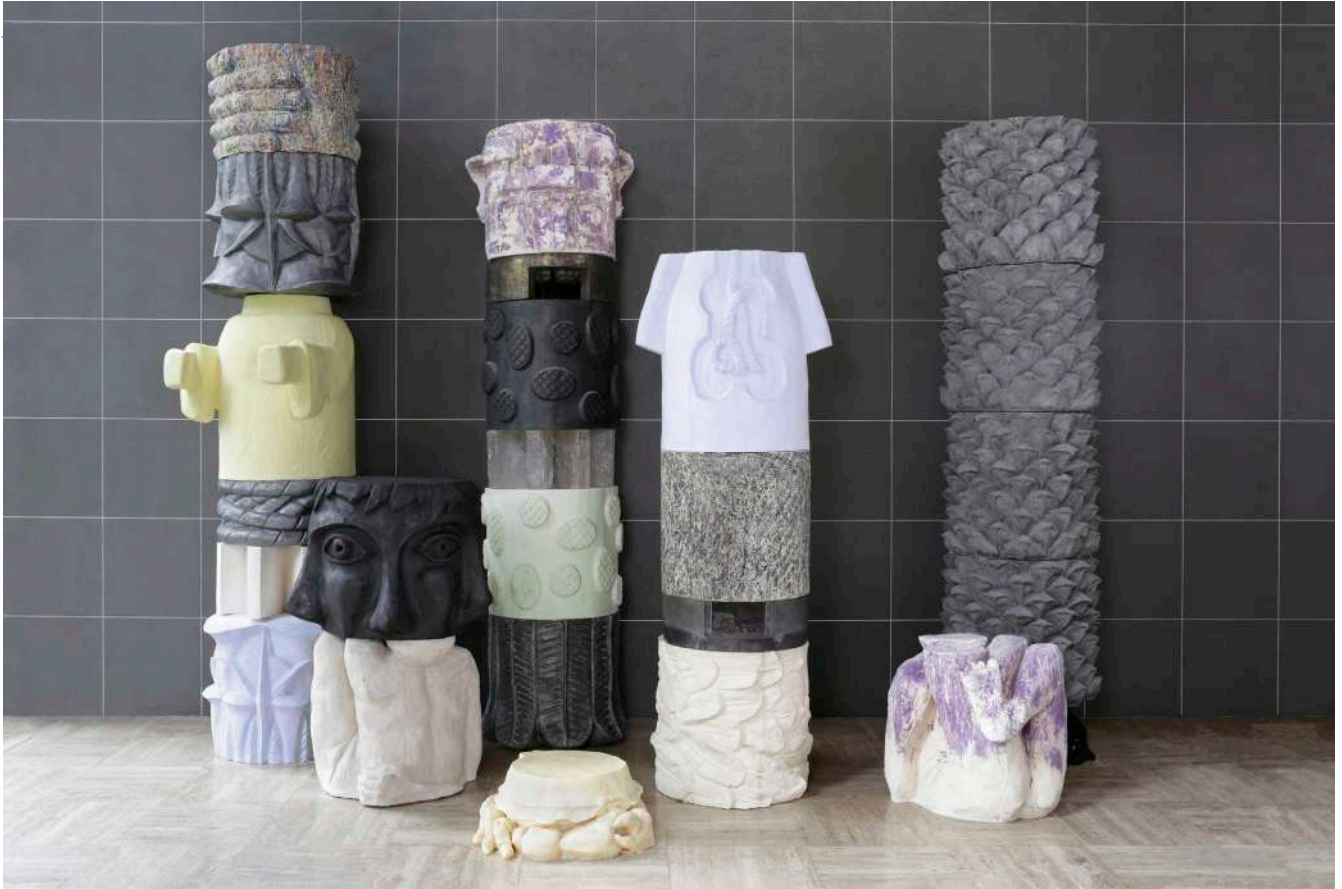
Marion Verboom, Lectio Difficilior Potior , 2016, 40 fragments, résine, plâtre teinté, gomme laque et pigments, © Nicolas Brasseur.