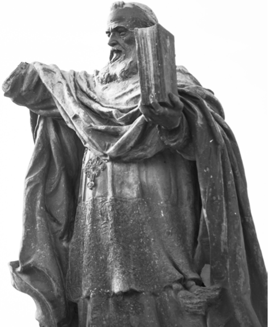
Statue du Cardinal Lavigerie par Elie-Jean Vézien, 1925. Alger Statue of Cardinal Lavigerie by Elie-Jean Vézien 1925. Algiers