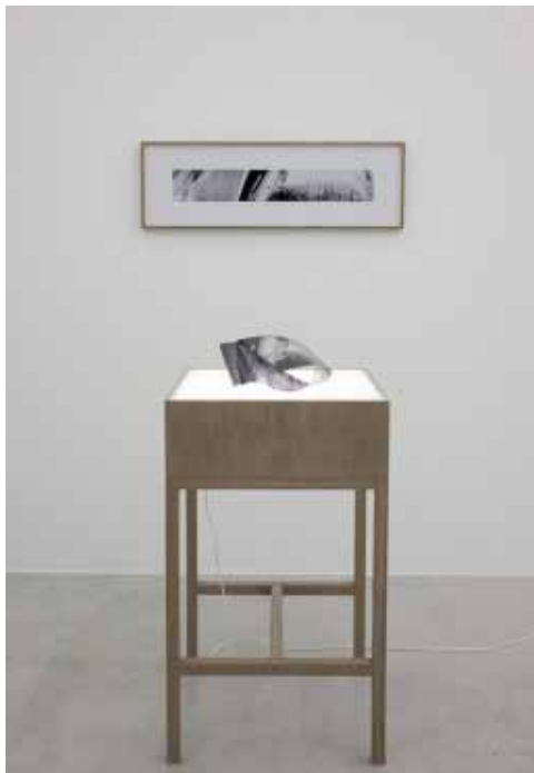
Attila CSÖRGÖ , Möbius space ( Kerguéhennec - 1 ), 2006 Table: 70 x 50 x 50 cm, photographie: 11 x 70 cm (sans cadre), transparent: 25 x 15 x 12 cm Photographie Noir et Blanc, Boucle transparente, table lumineuse