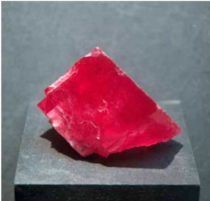
Cédric EYMENIER , Stone #003 , 2008 tirage Fine art sur papier Hahnemuhle 24 x 36 cm