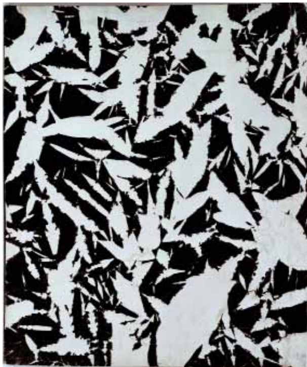
Simon HANTAÏ , Etude , 1969 52,4 x 63 cm, peinture sur toile