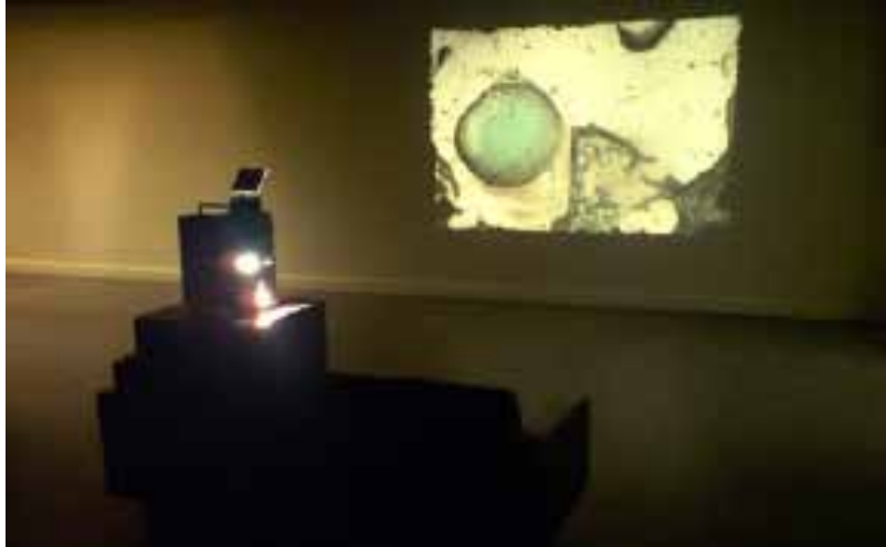
Juliana BORINSKI , LCD ( Liquid Crystal Display ), 2009 Installation, diapositive, projecteur Dimensions variables