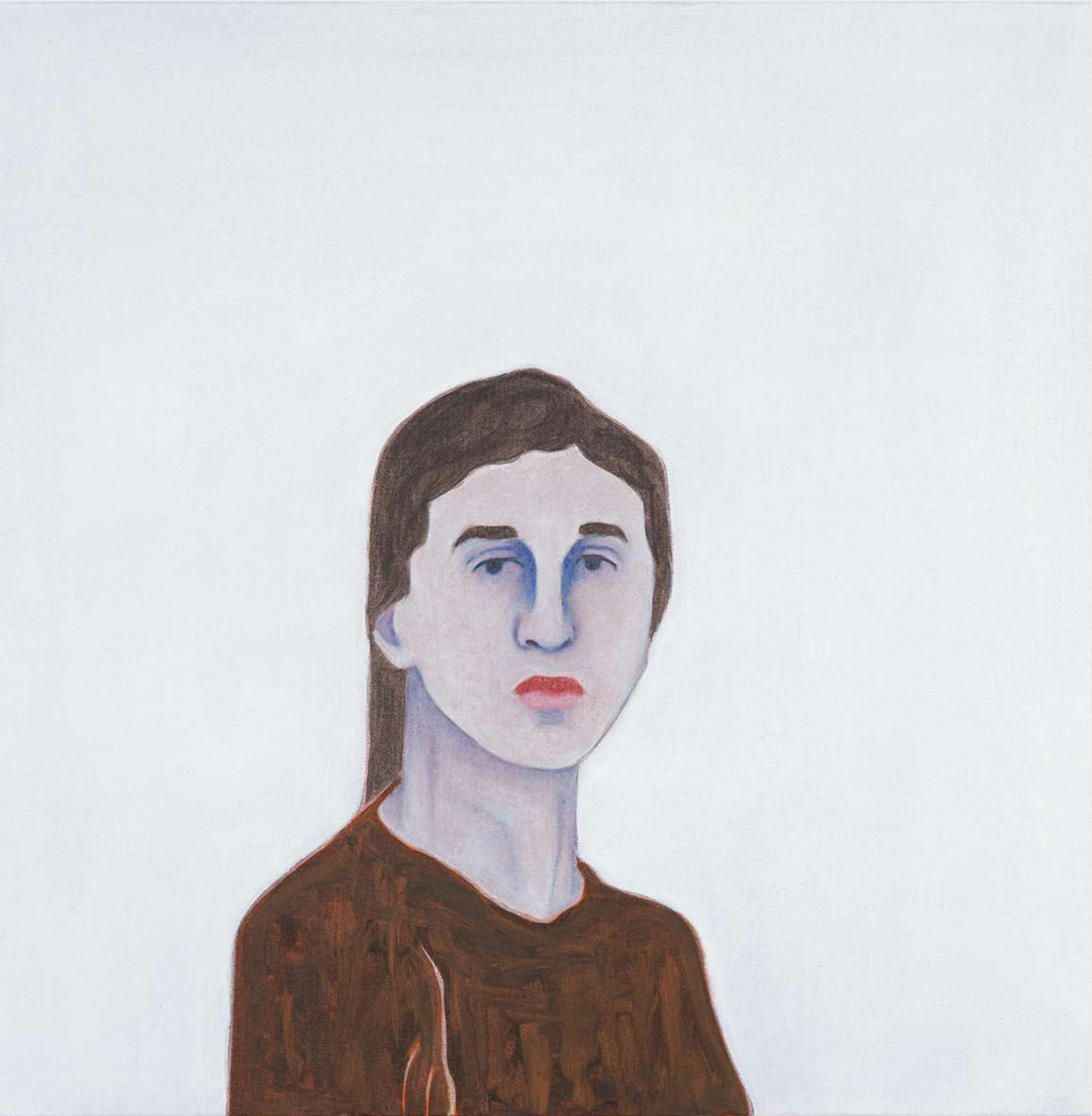
Djamel Tatah Untitled (Inv. 22011), 2022

Oil and wax on canvas 70 x 70 cm