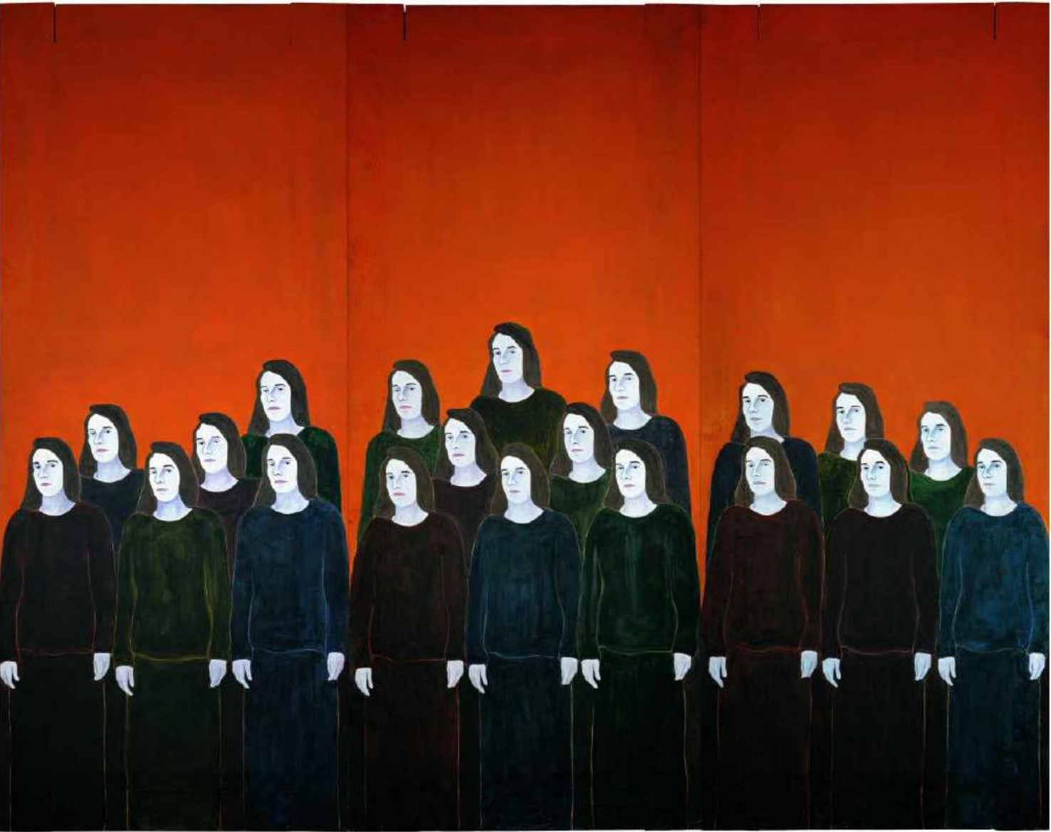
« Les Femmes d'Alger » (1996), de Djamel Tatah, huile et cire sur toile et bois, triptyque, Toulouse, collection Les Abattoirs, Musée-FRAC Occitanie-Toulouse, donation de la Caisse des dépôts et consignations. JEAN DE CALAN/ADAGP

Le malaise s'accroît face à la toile de 2005, de près de six mètres de long, exclusivement faite de la répétition d'un adolescent assis par terre qui dévisage le regardeur, obstinément. Quand les figures de profil d'adolescents sont peintes affrontées deux par deux ou en files parallèles allant en sens inverse l'une de l'autre, il y a tant de références historiques possibles, venues du XXe siècle ou prises aujourd'hui, qu'il ne semble pas excessif de dire que Tatah peint ici une allégorie des sociétés contemporaines uniformisées et rationalisées jusqu'à l'effacement de l'individu, qui n'est plus qu'un chiffre dans une liste.