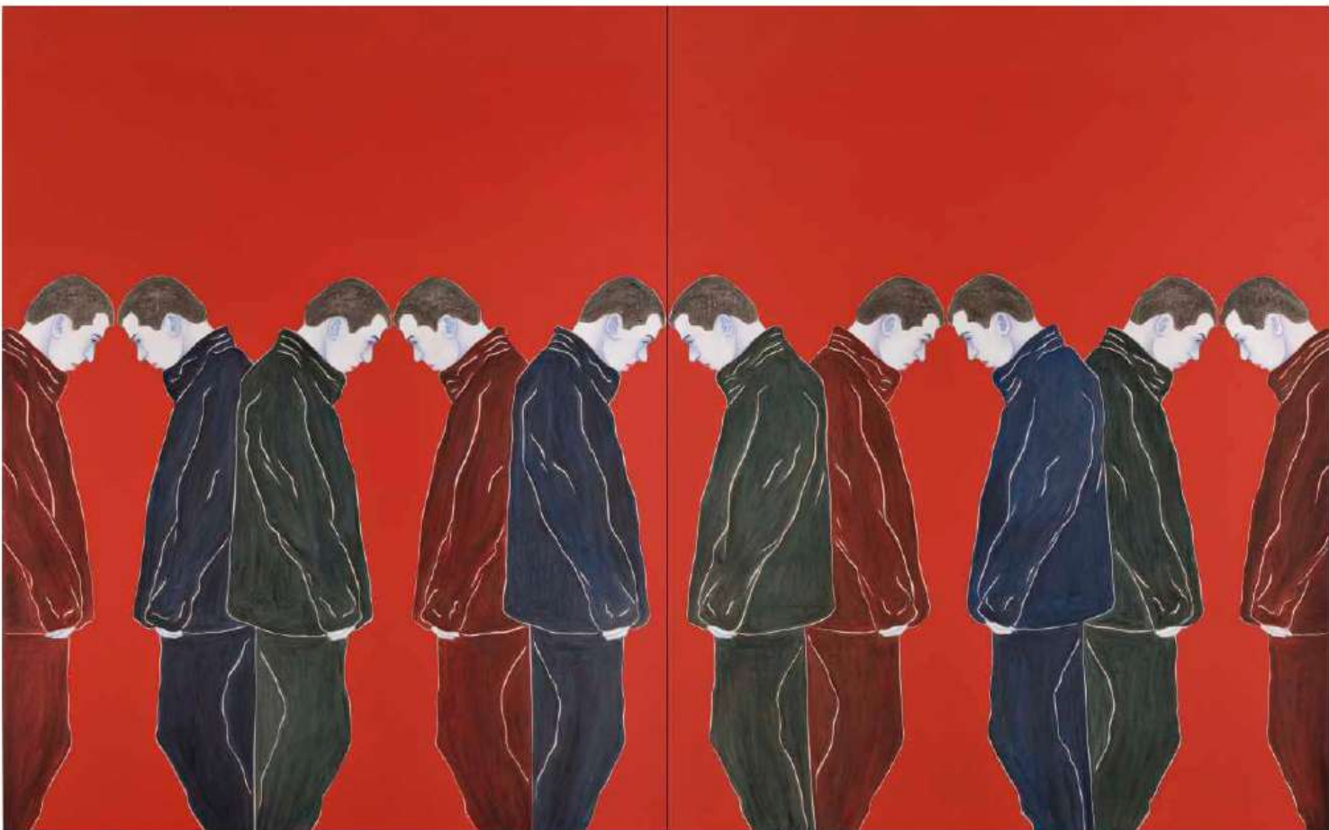
« Sans titre » (2016), de Djamel Tatah, huile et cire sur toile, diptyque, collection de l'artiste.

Dans ce dernier cas, la toile est accrochée bas, à la hauteur du visiteur, ce qui crée, un instant, l'illusion qu'une personne s'avance vers vous. A l'exception de ceux qui volent ou tombent, les corps ne sont pas agités par d'amples mouvements. On les suppose immobiles ou ne se déplaçant que lentement. Leurs gestes sont retenus. Autrement dit : on ne sait pas ce qui se passe et chaque scène invite à s'interroger sur les relations entre les personnages – ou sur leur possibilité même –, le sens de leurs postures, les émotions et les pensées qui les habitent. Un homme assis replié sur lui-même, un corps enveloppé dans un manteau ou un drap allongé à côté de lui et un marcheur entrant par la droite la tête baissée : ce ne peut être que solitude, absence et indifférence. Tatah ne précise pas le lieu, se passe de tout objet, refuse autant le pathétique que la description. Cette œuvre est la représentation visible d'une idée abstraite, celle de la distance qui s'est établie entre les êtres, si caractéristique des sociétés modernes.