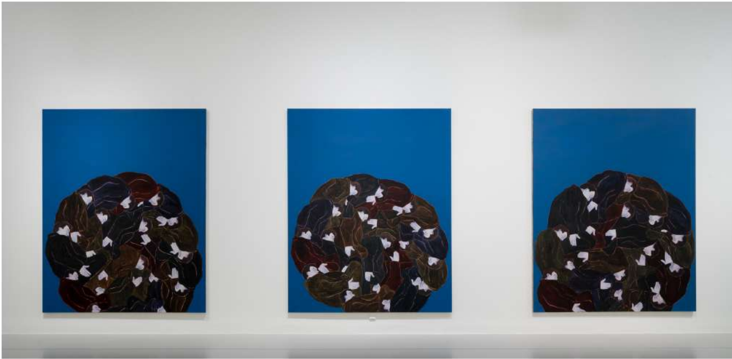
© Musée Fabre de Montpellier Méditerranée Métropole / photographie Frédéric Jaulmes -Reproduction interdite sans autorisation.

Une peinture érudite donc, mais à hauteur de spectateur. À rebours d'une peinture contemporaine hyperréaliste qui siphonne les codes de l'imagerie Instagram et d'une figuration qui mythifie le corps, dans sa monstruosité ou dans sa puissance, les silhouettes hiératiques de Djamel Tatah posent un éternel point d'interrogation aux regards et hantent longtemps l'esprit. « Imposer le silence face au bruit du monde, c'est en quelque sorte adopter une position politique », affirme l'artiste. Le Théâtre du silence s'ouvre avec une reproduction de la stèle construite en hommage à Albert Camus à Tipaza en Algérie, et la citation qui y est gravée : « Je comprends ici ce qu'on appelle gloire : le droit d'aimer sans mesure. » L'aura de cet « humaniste athée » donne peut-être une clef de lecture : il faudrait imaginer la présence persistante et absurde de ces personnages solitaires comme une incarnation de la révolte.