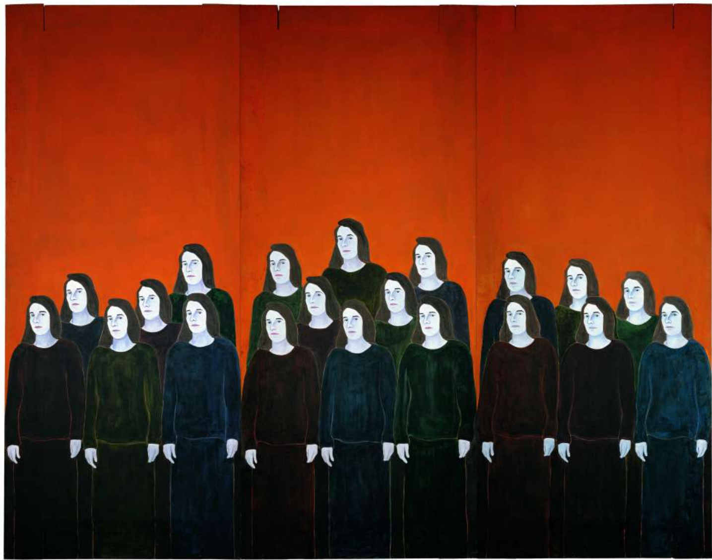
Djamel TATAH, Les Femmes d'Alger, 1996, Toulouse, Collection les Abattoirs, Musée -Frac Occitanie Toulouse,donation de la Caisse des dépôts et consignations,inv. 2004.3.3.