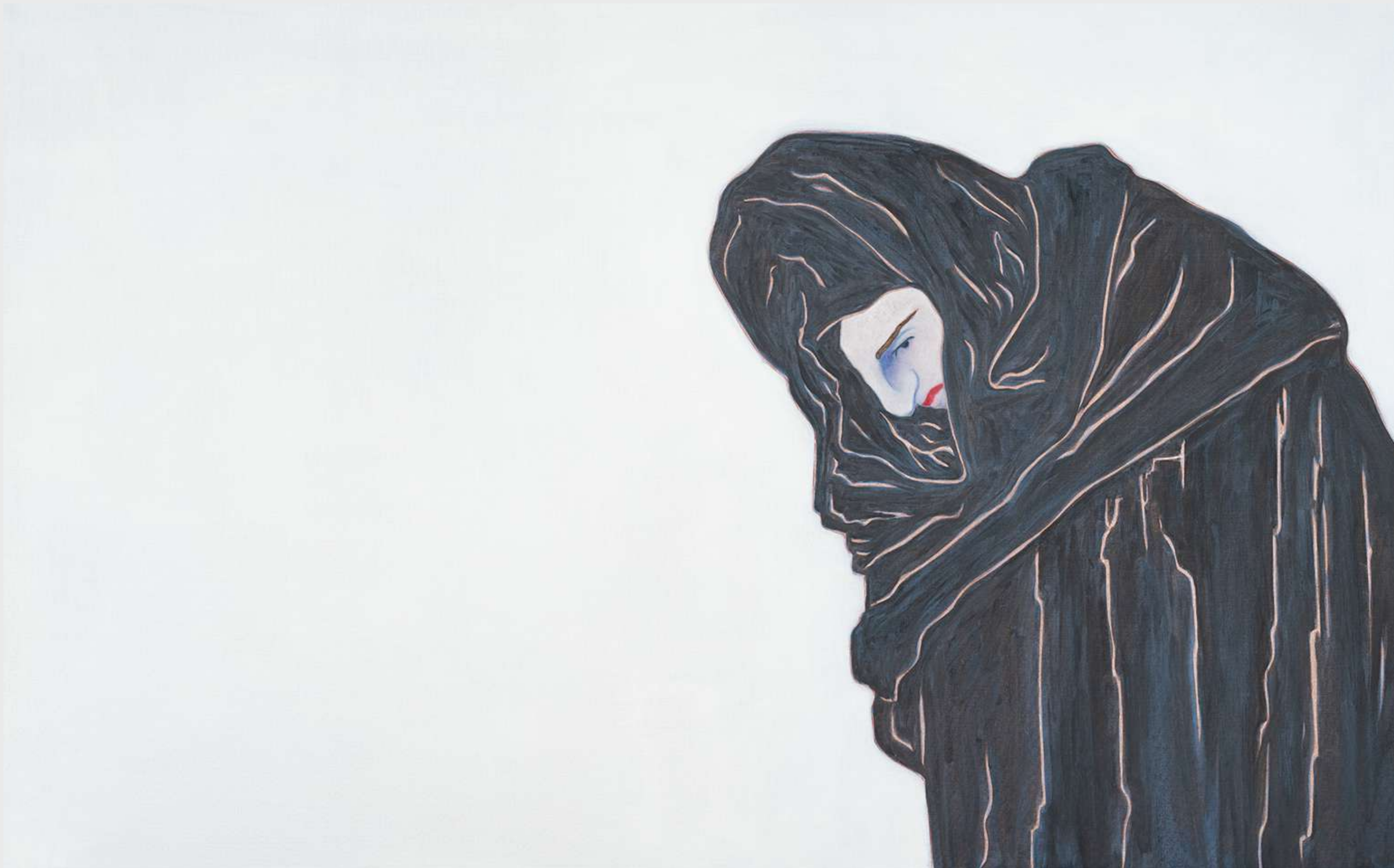
Djamel Tatah Untitled (Inv. 22016), 2022

Oil and wax on canvas 100 x 160 cm