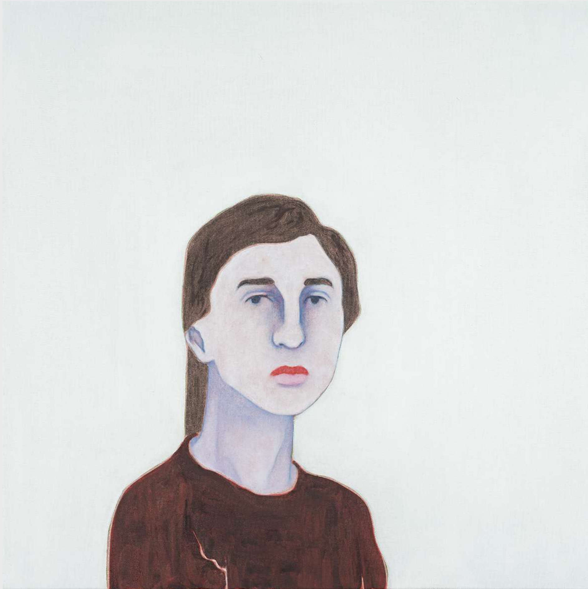
Djamel Tatah Untitled (Inv. 22010), 2022

Oil and wax on canvas 70 x 70 cm Courtesy the artist and Galerie Poggi, Paris @ Franck Couvreur