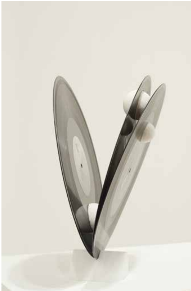
Kapwani Kiwanga Hydrospheres , 2015 Vinyles, sel

Depuis sa performance à la Tate Modern en avril 2014, Kapwani Kiwanga est particulièrement présente sur la scène artistique londonienne. La South London Gallery, une de plus importantes institutions publiques d'art contemporain à Londres, vient de lui consacrer une importante exposition personnelle (Kinjiketile suite, 15 avril - 7 juin 2015). C'est dans cette dynamique que la galerie présente un solo show de l'artiste à Somerset House, dans le cadre de la foire 1:54. Créée en 2013, cette foire consacrée à l'art contemporain africain est devenue un des événements les plus pointus et incontournables pendant la semaine de Frieze.