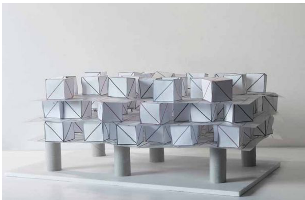
Yona Friedman, Ville Spatiale , 1980, collection du MAMVP

L'artiste présentera également une série de maquettes historiques et récentes liées à sa pratique expérimentale de l'architecture. Ces maquettes d'études reflètent les idées développées par Yona Friedman et ses concepts majeurs : la « Ville spatiale », les « containers » et les « cylindres », les « Merz strukturen », les « gribouillis » et les structures « moebiennes ». Réalisées le plus souvent à partir de matériaux pauvres et de récupération, elles offrent une matérialisation des théories développées par l'artiste tout au long de sa carrière tout en révélant la portée utopique et prospective d'une conception de l'architecture tournée vers l'avenir et éprouvée par les besoins et les espoirs de l'humanité.