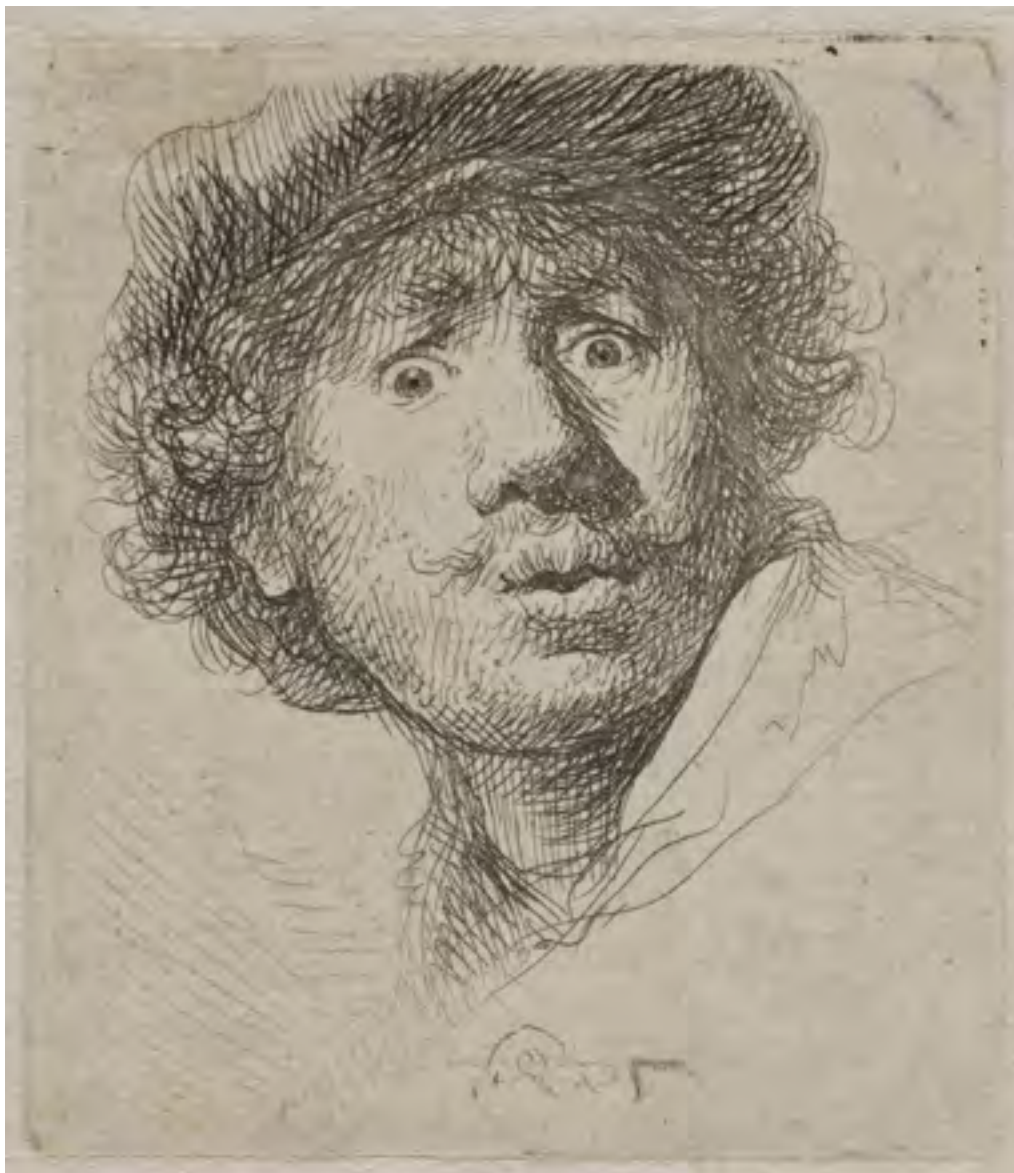
Rembrandt Harmenszoon van Rijn, Rembrandt au bonnet coupé , 1630.