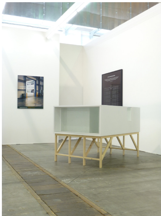
Vue de l'exposition à ArtBrussels, Sightseeing , , Galerie Jérôme Poggi, 2014