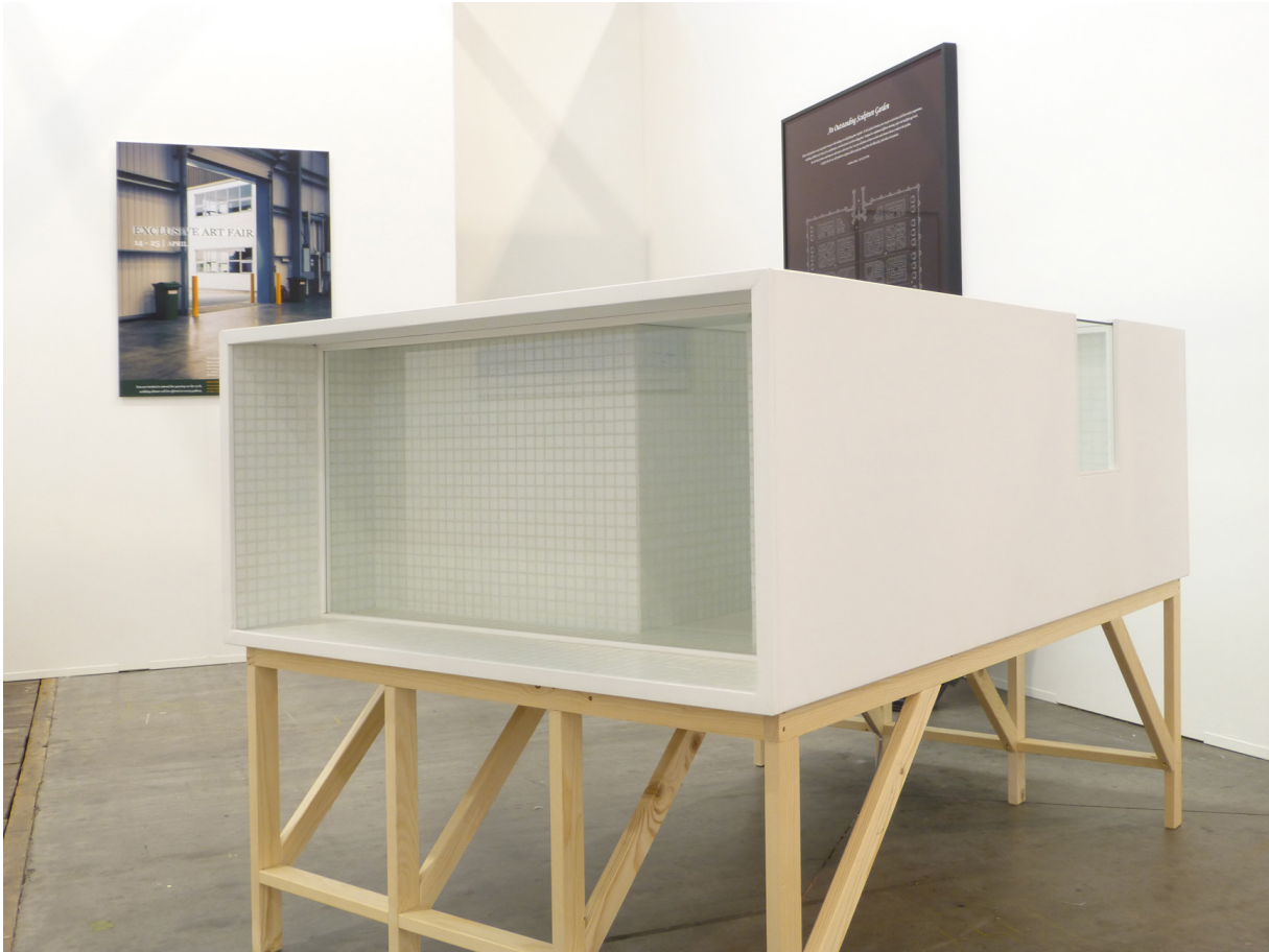
Wesley Meuris, Sans Titre , 2014 boite blanche : 107,5 x 161,5 x 53, piètement ; 53 cm, Pièce unique