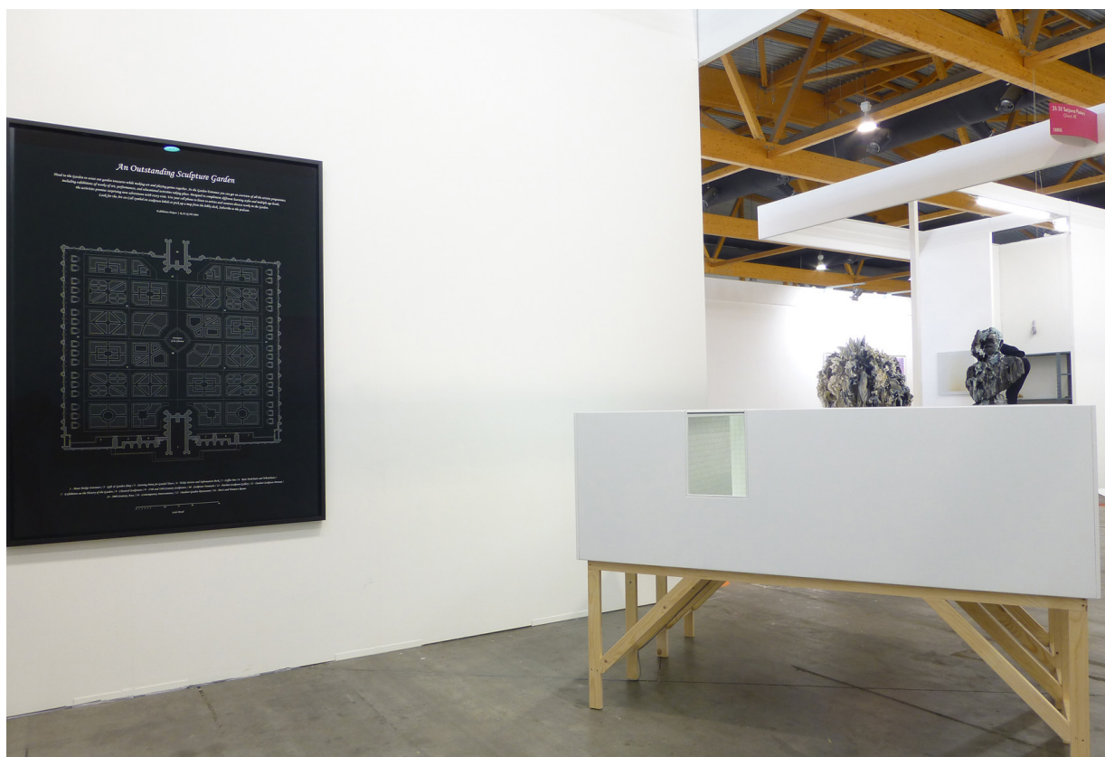
Vue d'exposition, Sightseeing , ArtBrussels Booth, Galerie Jérôme Poggi, 2014