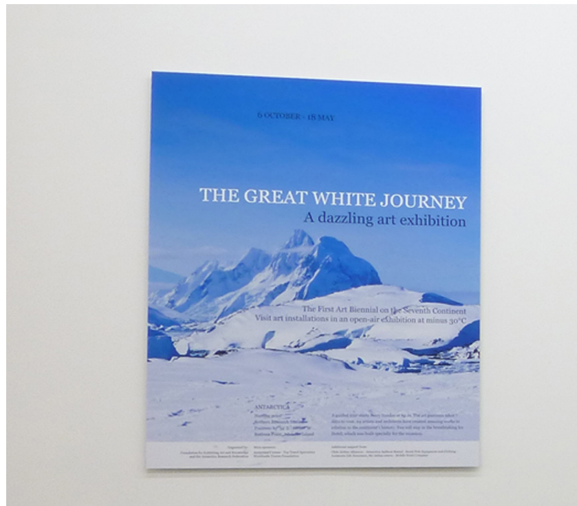
Wesley Meuris , The Great White Journey , 2012 Impression sur papier photorag montée sur dibond, 100 x 80 cm, Edition de 3