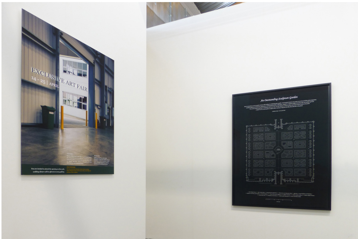
Vue de l'exposition à ArtBrussels,, Sightseeing ., Galerie Jérôme Poggi, 2014