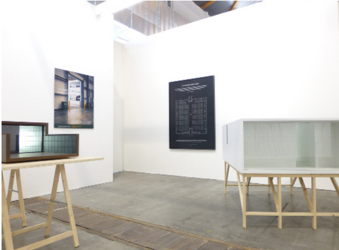
Vue d'exposition à ArtBrussels, Sightseeing , Galerie Jérôme Poggi, 2014