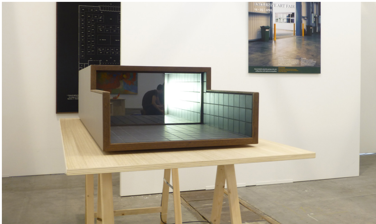
Wesley Meuris , Sans Titre , 2014 Boîte noire : 57,5 x 140, 5 cm x 32, table : 162,5 x 82 x 74, pièce unique