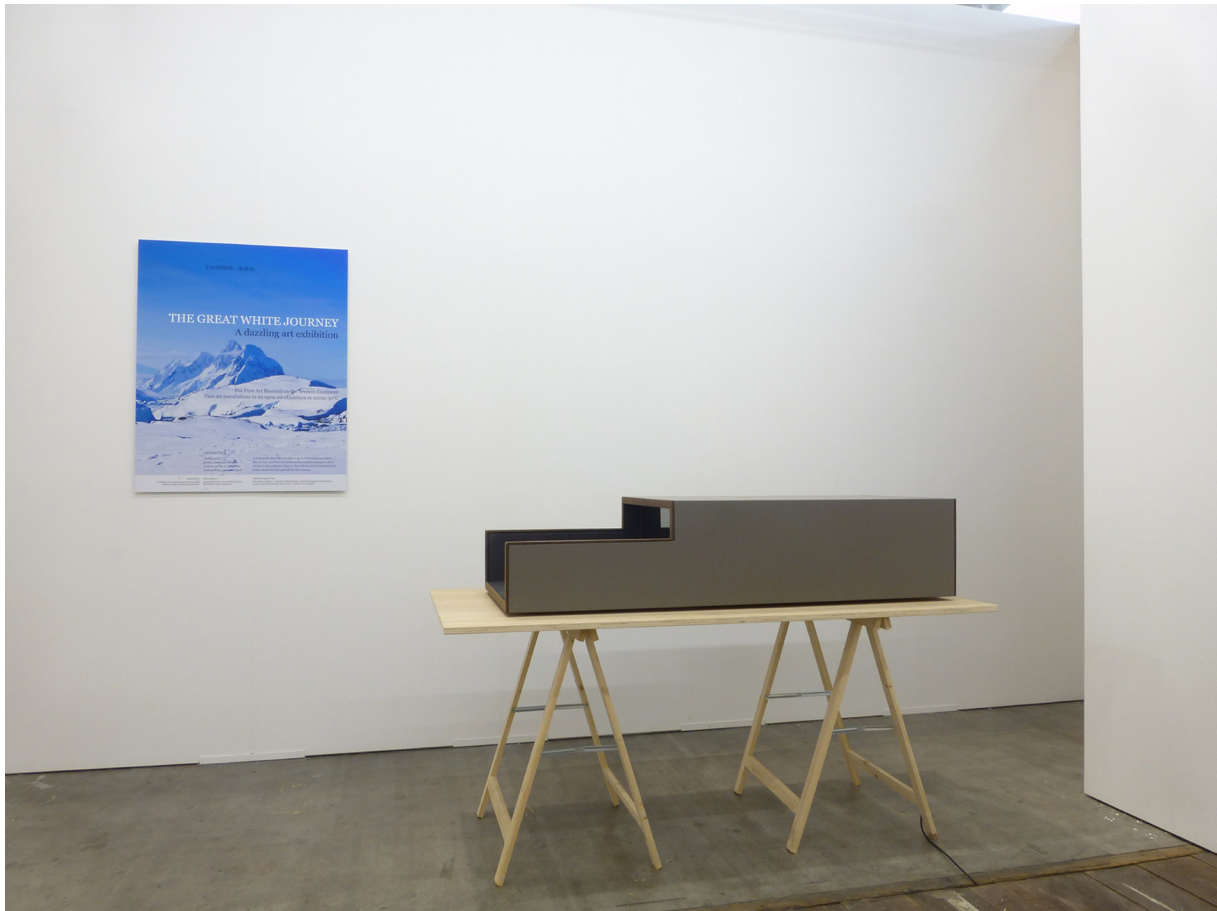
Vue de l'exposition à ArtBrussels, Sightseeing , Galerie Jérôme Poggi, 2014