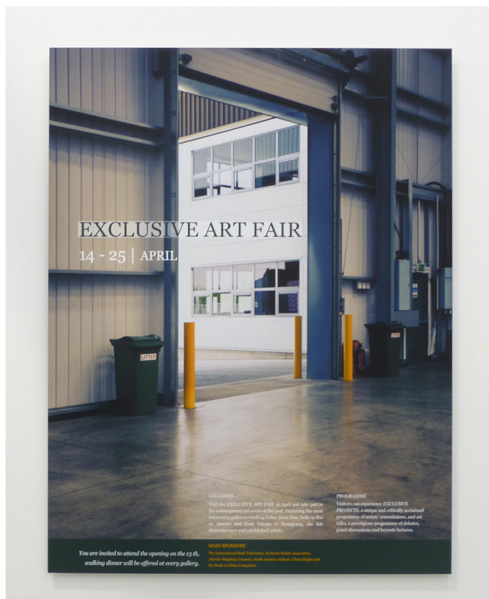
Wesley Meuris, Exclusive Art Fair , 2014 , Impression sur fotorag, contrecollé sur dibond, 100 x 80 cm, Edition 2/3 +1AP